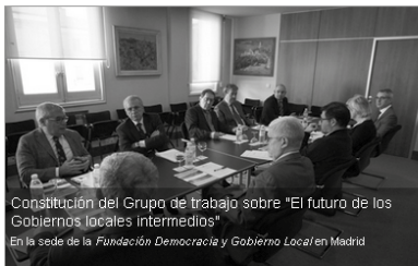
Constitución del Grupo de trabajo sobre "El futuro de los Gobiernos locales intermedios" En la sede de la Fundación Democracia y Gobierno Local en Madrid

Constitución del Grupo de trabajo sobre "El futuro de los Gobiernos locales intermedios"